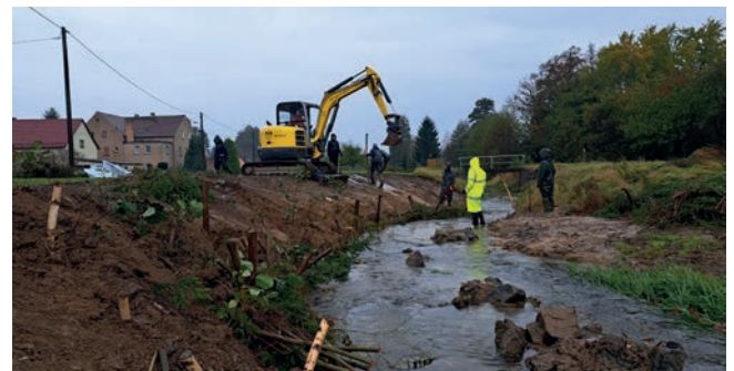
Bereits im nächsten Jahr werden hier die Gehölze austreiben und einen naturnahen Ufersaum bilden. · Foto: Wetzelt, LfULG

An einem Gewässer im Landkreis Bautzen wurde so eine naturnahe Umgestaltung nun vorgenommen. Genauer gesagt, am Haselbach in der Gemeinde Haselbachtal. Die Maßnahme wurde im Rahmen einer Fortbildung als Bauseminar umgesetzt, bei dem freiwillige Helfer tatkräftig mitgewirkt haben. Zuerst wurden die notwendigen Absprachen mit den zuständigen Behörden getroffen und Genehmigungen eingeholt, dann konnte es losgehen. Was braucht man nun, um einen Gewässerabschnitt umzugestalten? Man braucht dazu unter anderem eine engagierte Gemeinde, kooperative Flächeneigentümer, einen Bagger, 80 Gehölze, 23 Reisigbündel (Faschinen genannt), 200 Weidensteckhölzer und 25 fleißige Helfer. Dazu noch ausreichend Spaten, Astscheren, Sägen und jede Menge Motivation, dann kann es losgehen. Auf einer Länge von über 100 Metern wurde der begradigte und verbaute Haselbach mit einem Bagger vom Granitsteinverbau befreit und geschwungener gestaltet. Die neu geschaffenen Ufer wurden anschließend von den Helfern bepflanzt. Weiden, Erlen und Traubenkirschen bilden hier bald einen naturraumtypischen Gehölzbestand, der das Ufer sichert und zugleich den Fischen und anderen Tieren einen Lebensraum bietet.